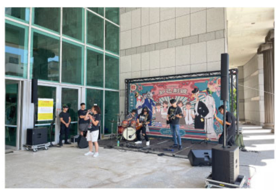
社團博覽會 知己制彼活動花絮