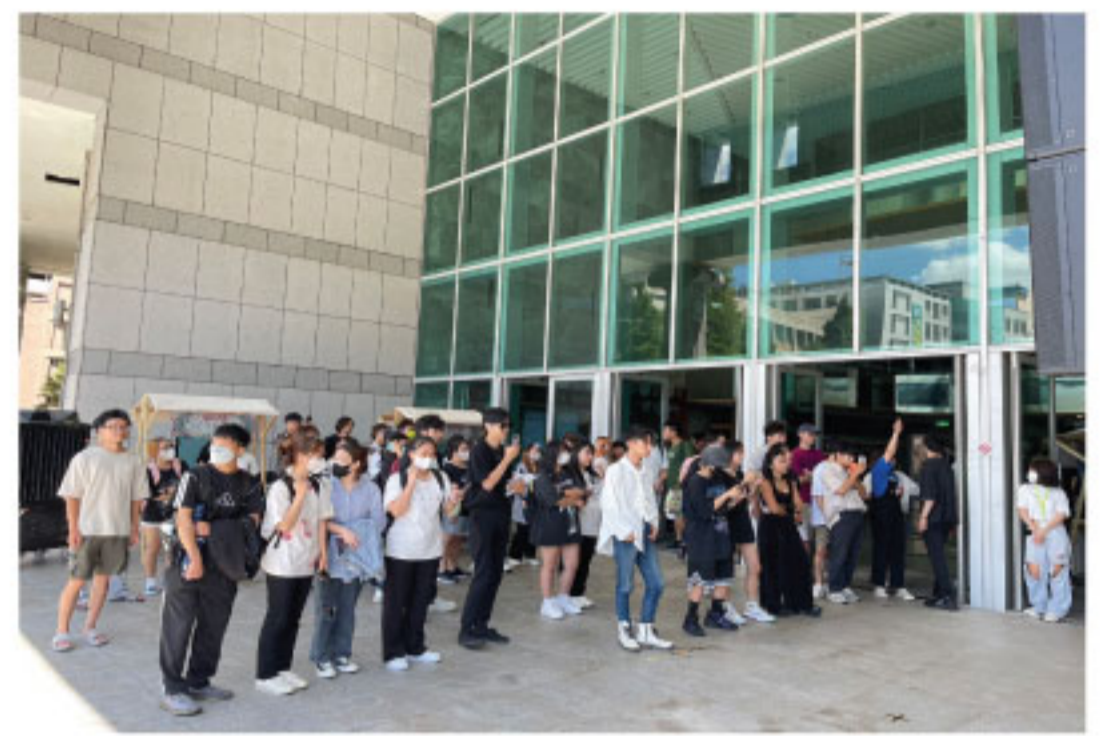
112評鑑工作坊-蛻變尋夢 活動花絮